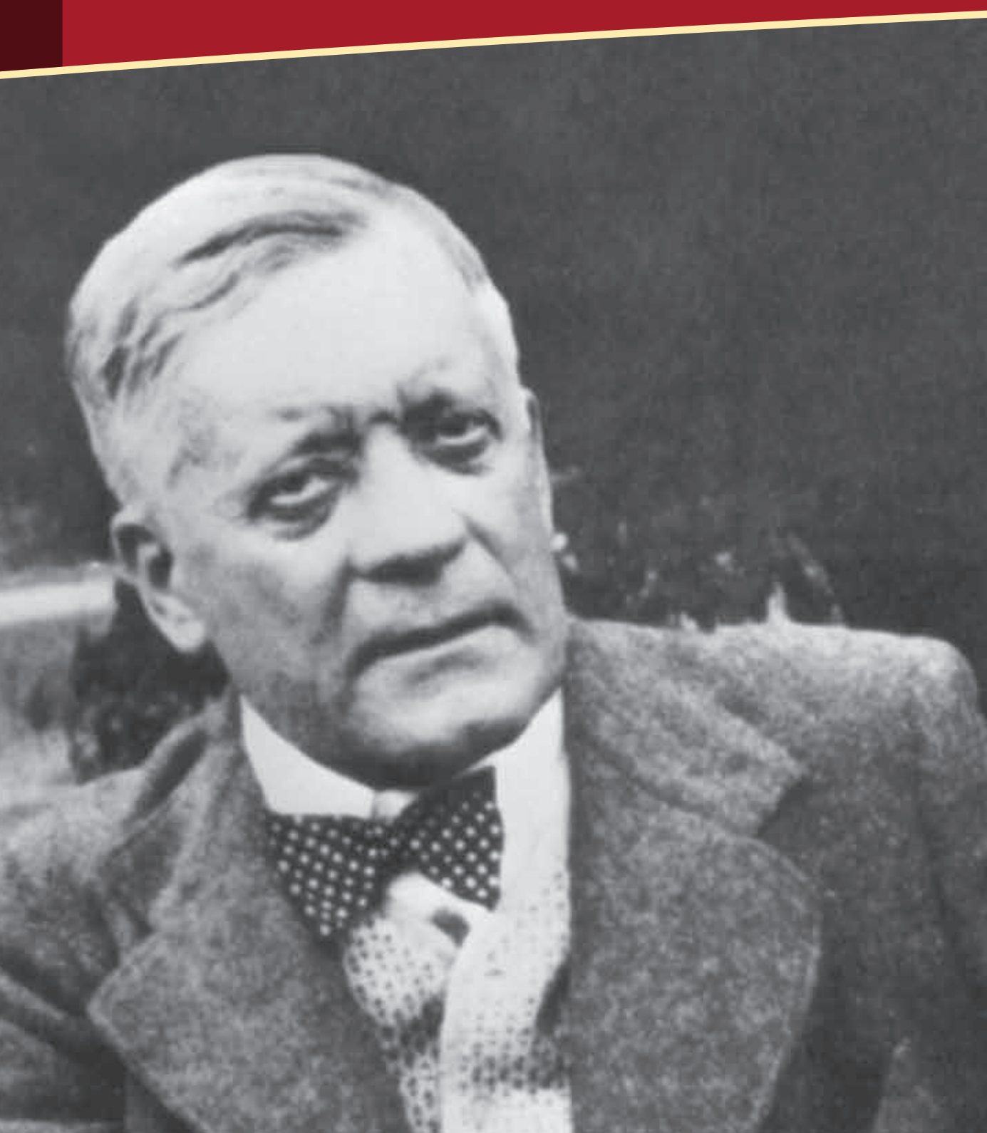
Граф фон Польцер-Ходітц