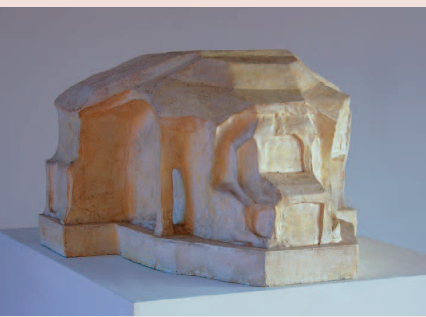
Макет Рудольфа Штайнера для нового Гетеануму