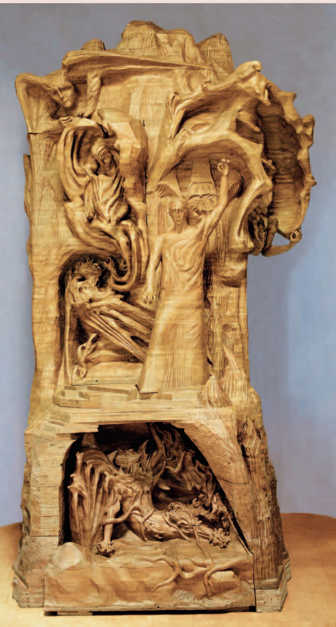
Вирізьблена Р. Штайнером статуя представника людства висотою дев'ять метрів