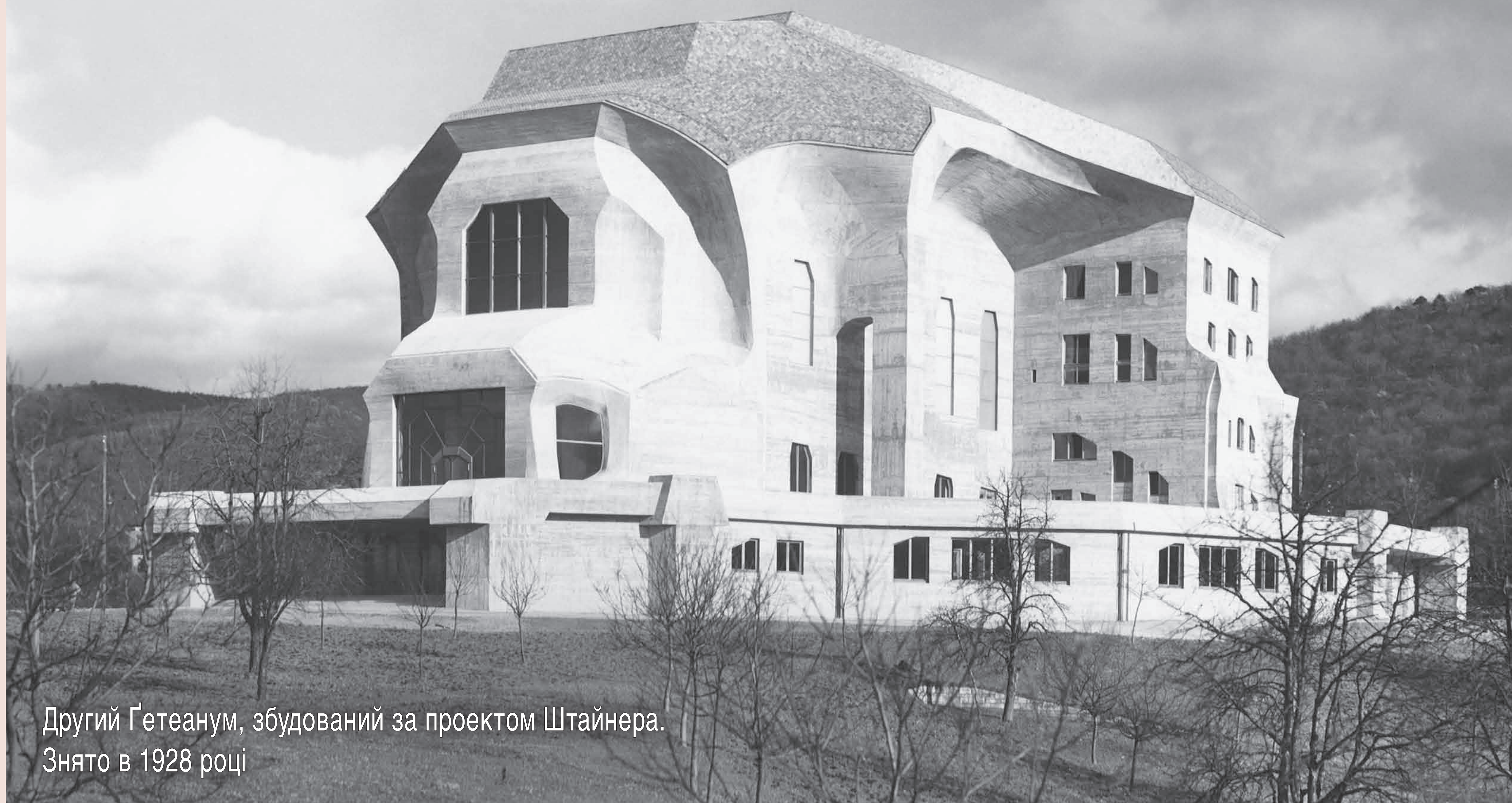
Другий Гетеанум, збудований за проектом Штайнера. Знято в 1928 році

„Щось небачене досі, від чого, бува, аж забракне подиху, несли в собі наповненість і манера діяти Рудольфа Штайнера в ті місяці 1924 року, коли він іще міг виступати з доповідями. При цьому було видно, які тяжкі вже були його тілесні страждання й боротьба з ними. Часто здавалося, що сили його полишають, це лякало друзів, і вони просто тремтіли за нього.“