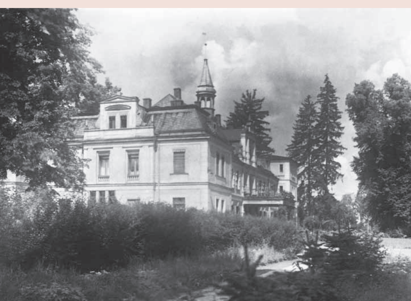
Замок Кобервітц, червень 1924 р.